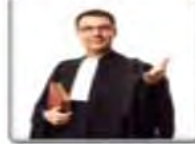
Un avocat محام